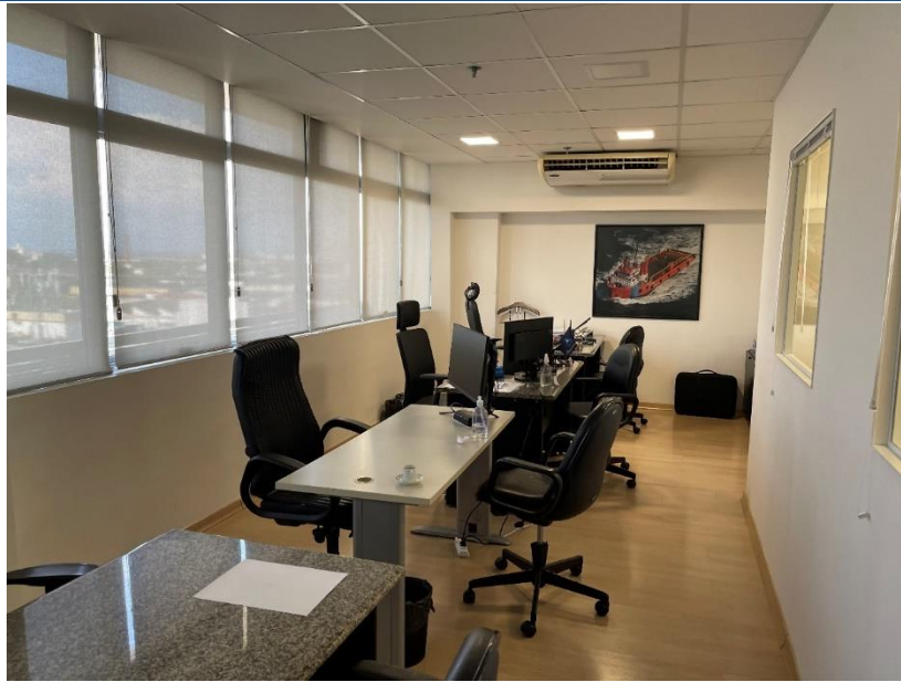
Sala da Diretoria