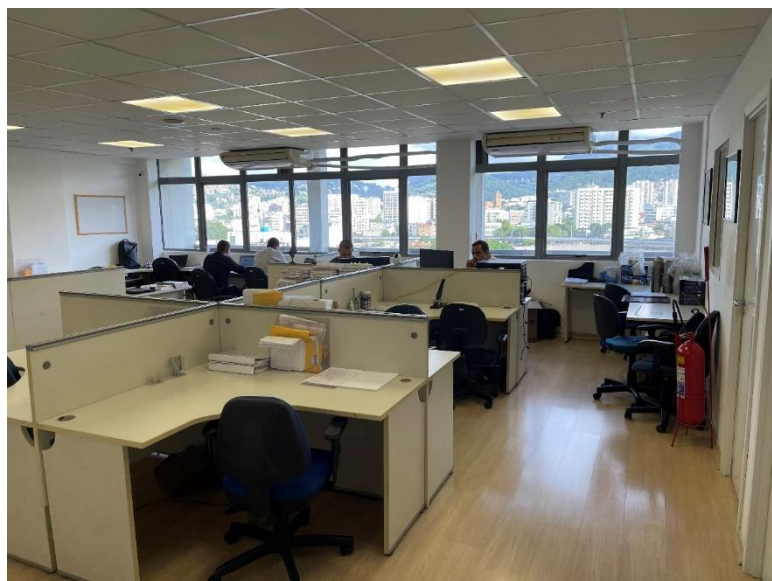
Área da empresa com suprimentos, manutenção e T.I.