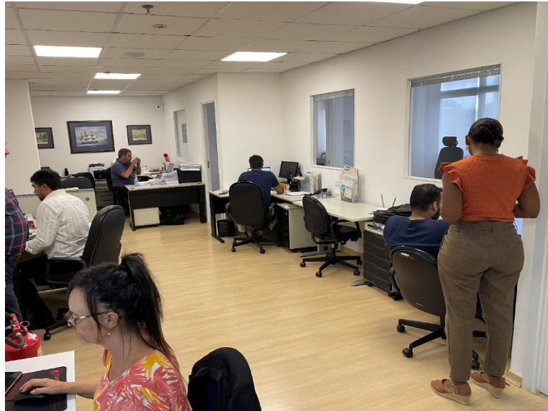
Colaboradores da parte administrativa da empresa