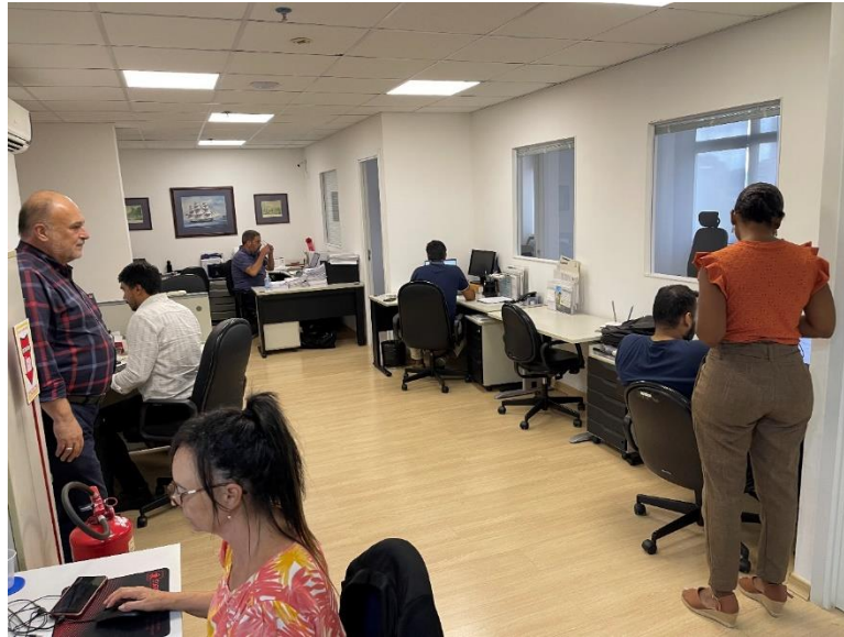
Figura 3- Colaboradores da parte administrativa da empresa