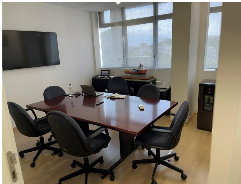
Sala de reunião