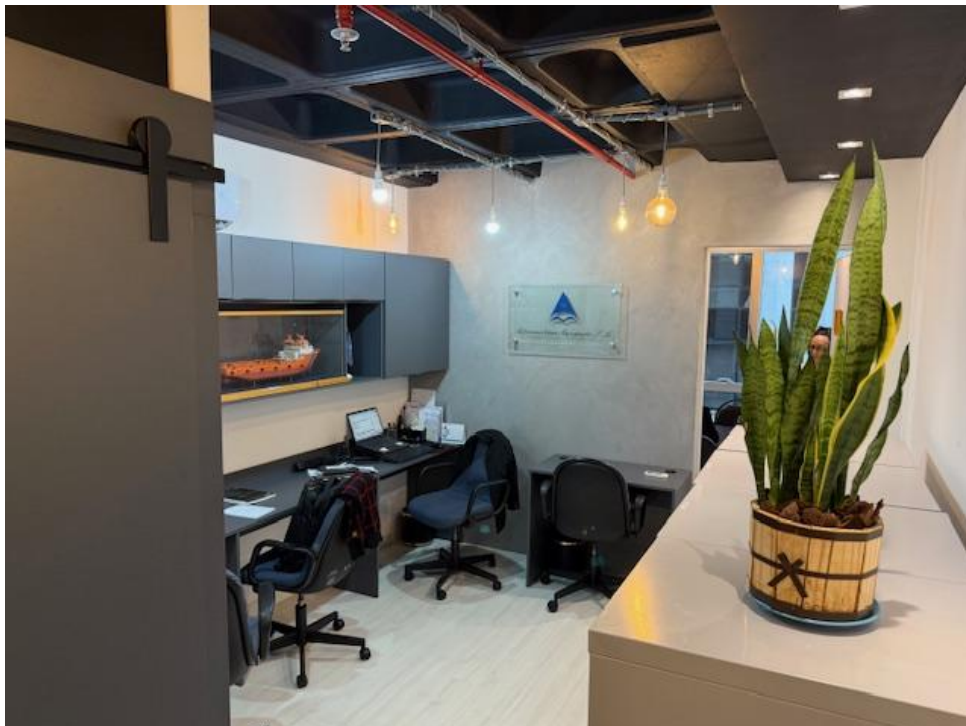
Figura 3 - Recepção