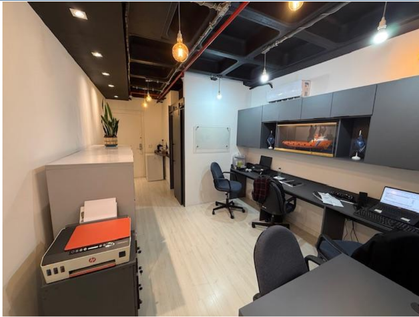
Figura 1 – Escritório