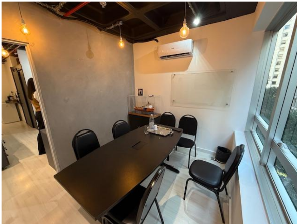
Figura 2 - Sala de Reunião