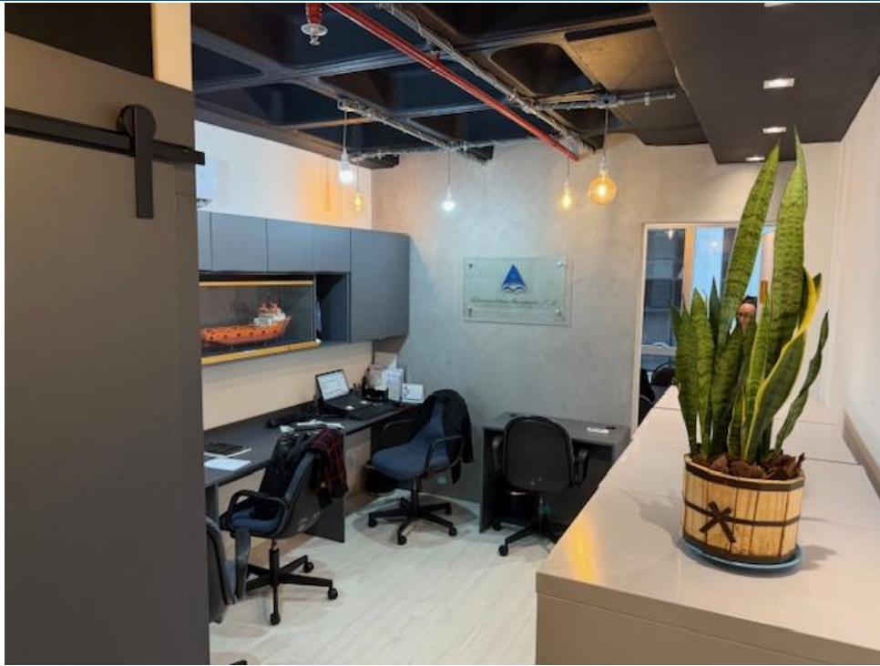
Figura 3 - Recepção